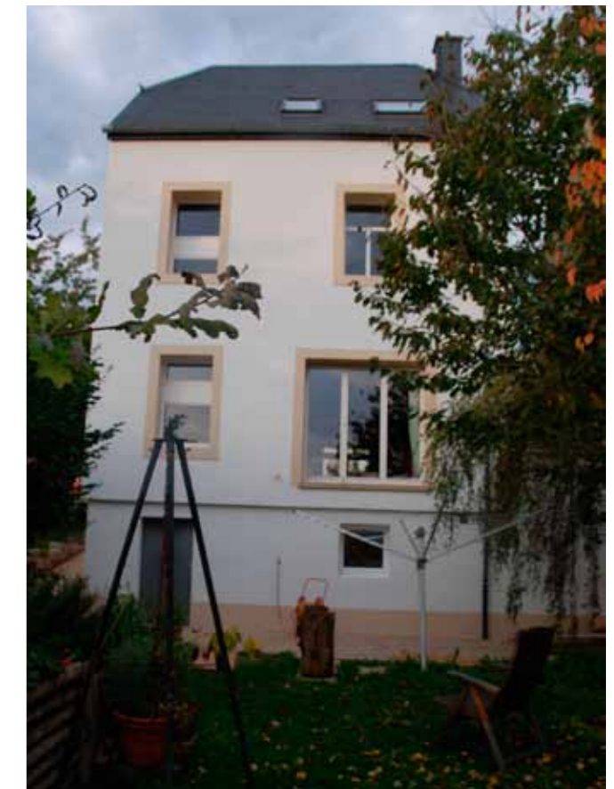
Nach Sanierung mit Außenwanddämmung