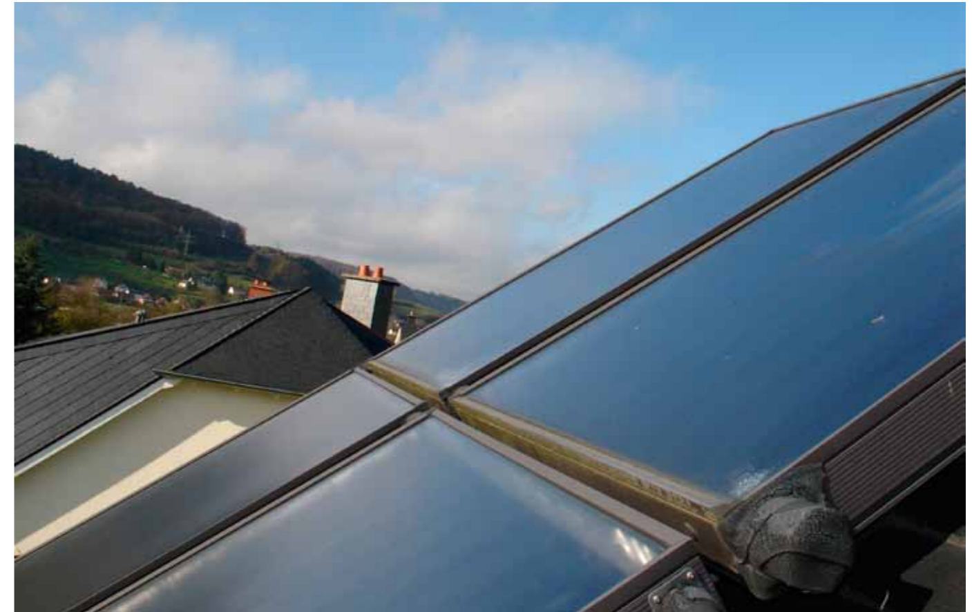
Flachkollektor – thermische Solaranlage